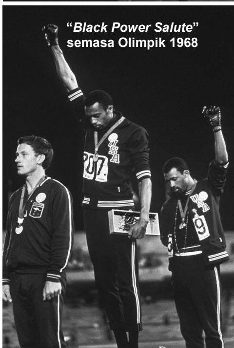
"Black Power Salute" semasa Olimpik 1968