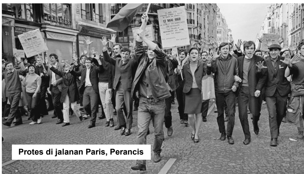
Protes di jalanan Paris, Perancis

Gelombang kebangkitan rakyat pada tahun 1968, telah membuka minda rakyat sedunia untuk imaginasi pembebasan masyarakat yang sebenar. Imaginasi ini tidak pernah luntur walaupun sudah berlalunya 50 tahun, malah terus memberikan ilham kepada kita tentang satu dunia yang berbeza adalah berkemungkinan. ##