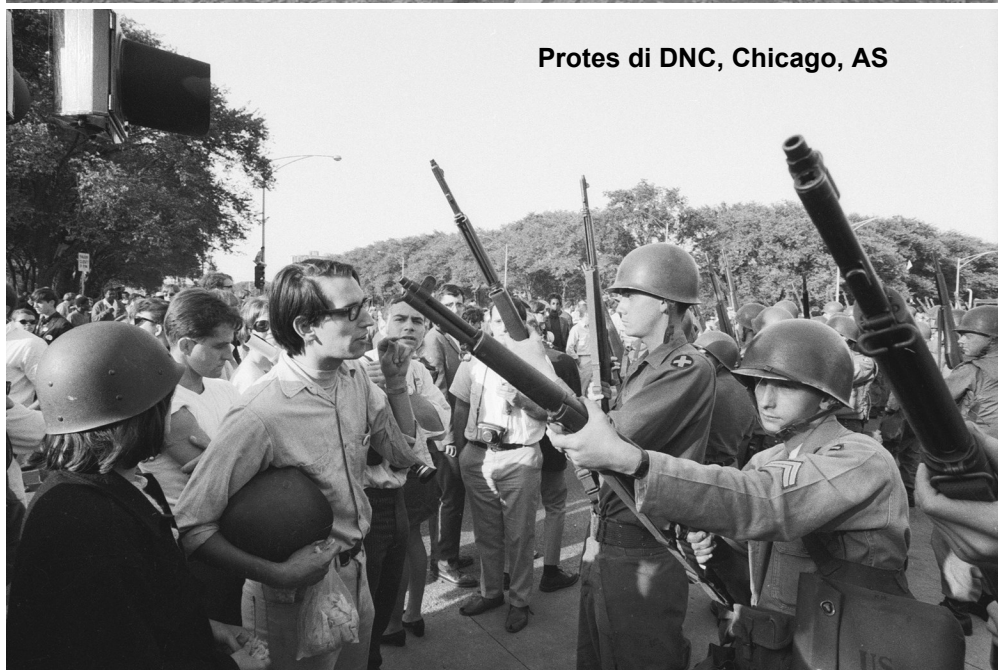
Protes di DNC, Chicago, AS